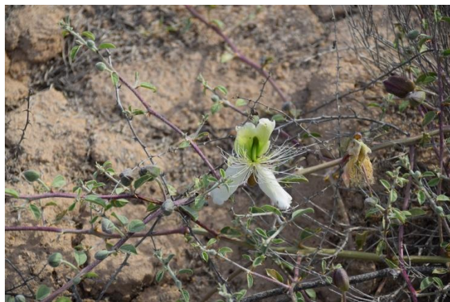
Каперсы колючие ( Capparis spinosa )