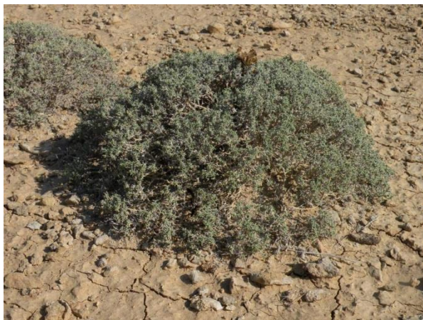
Саксаульчик Лемана ( Arthrophyton lehmanianum )