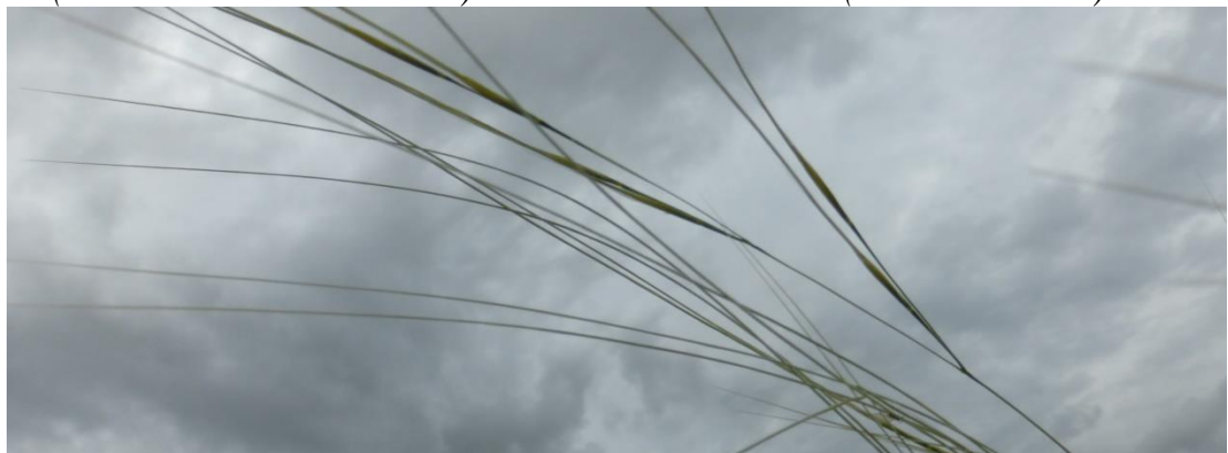
Ковыль сарептский ( Stipa sareptana )