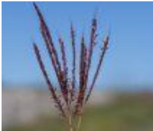
Бородач кровеостанавливающий ( Botriochloa ischactum )