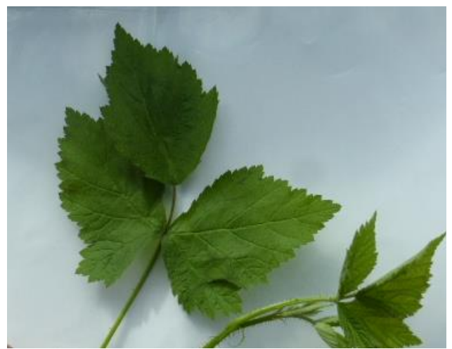
Ежевика ( Rubus caesius )