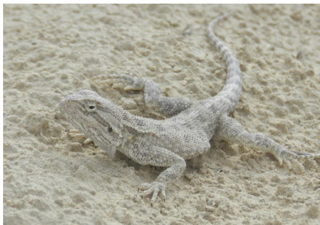
Степная агама ( Agama sanguinolenta )

6 Объекты историко-культурного наследия, расположенные на территории: Подземная мечеть и некрополь Султан Епе.