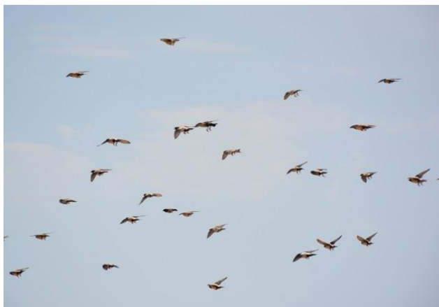
Розовый скворец ( Pastor roseus )

(перечисляются индикаторные виды и объекты мониторинга животных)