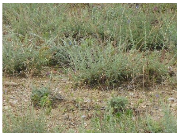
Полынь гурганская ( Artemisia gurganica )