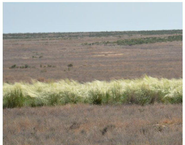
Ковыль сарептский ( Stipa sareptana )