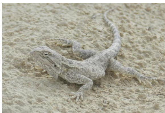
Степная агама ( Agama sanguinolenta )

6 Объекты историко-культурного наследия, расположенные на территории: Наскальная мечеть Шакпак ата.