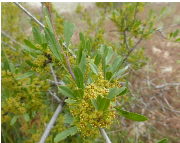
Жостер Синтениса ( Rhamnus sintenisii )