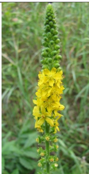
Репейничек азиатский ( Agrimonia asiatica )